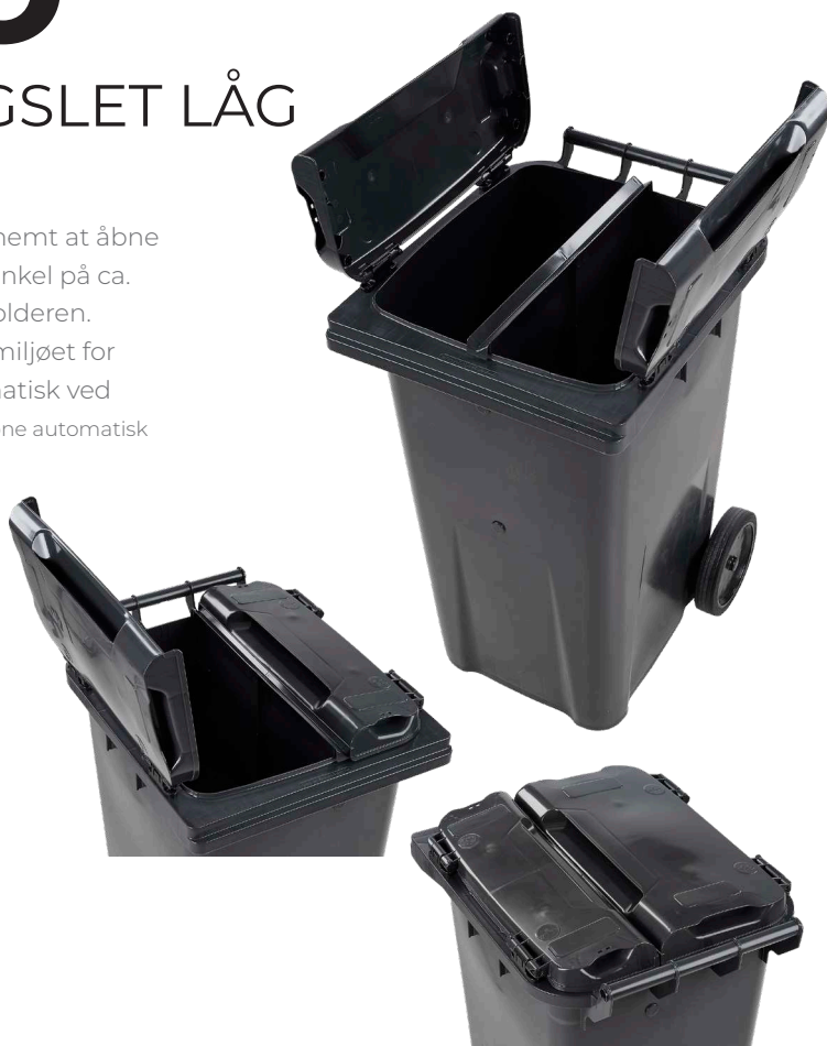
Sidehængslet låg 40/60